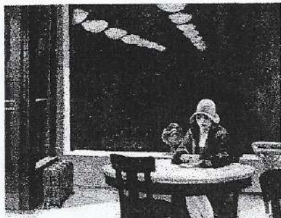
Edward Hopper, Automat (Tavola calda) , olio su tela, 1927, Des Moines, Des Moines Art Center