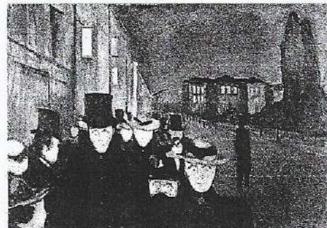
Edvard Munch, Sera sul viale Karl Johan , olio su tela, 1892, Bergen, Collezione Rasmus Meyer / Museo d'arte di Bergen

«Mi sembra che potrò facilmente dimostrare la felicità dell'esser solo, se insieme additerò gli svantaggi e gl'inconvenienti del trovarsi in molti, passando in rassegna le azioni degli uomini che questa vita (la solitaria) rende amanti della pace e tranquilli, quella violenti, preoccupati, affannosi. Uno è infatti il fondamento di tutto ciò: questa vita si basa su di un ozio sereno, quella su di una triste attività. [...] dimmi, o padre, quanto valuti tu questi beni che sono alla portata di tutti: vivere come vuoi, andare dove vuoi, stare dove vuoi, [...] in ogni stagione essere padrone di te, e, dovunque ti trovi, vivere con te stesso, lontano dai mali, lontano dall'esempio dei cattivi, senza essere spinto, urtato, influenzato, incalzato; senza essere trascinato a un banchetto mentre preferiresti aver fame, costretto a parlare mentre bramaresti star zitto, o salutato in un momento inopportuno, o afferrato e trattenuto agli angoli delle strade [...]. Frattanto, stare come in un posto di vedetta, osservando ai tuoi piedi le vicende e gli affanni degli uomini, e vedere ogni cosa – e particolarmente te stesso – passare con tutto l'universo; [...] dimenticare così gli autori di tutti i mali che ci sono accanto, talvolta anche noi stessi, e spinger l'animo tra le cose celesti innalzandolo al di sopra di sé [...]. È questo un frutto – e non è l'ultimo – della vita solitaria: chi non l'ha gustato non l'intende.»